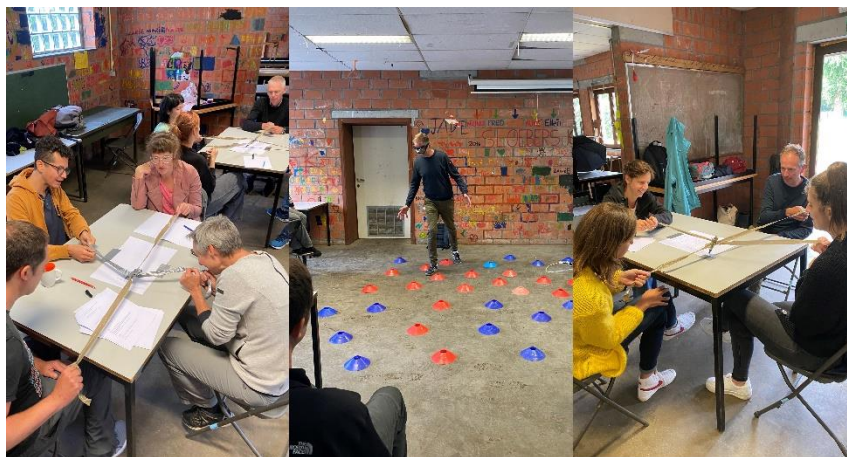
Sfeerbeeld van de SRH-dag met het team van beschut wonen De Hulster

Enkele malen per jaar een moment SRH inplannen op de agenda. Dit zal in toekomst ook team overschrijdend zijn, hiervoor werd reeds een samenwerking met het mobiele team van De Hulster gestart. We werken hierrond in 2022 ook samen met onze nieuwe collega's van Fides – beschut wonen Antenne Aarschot.