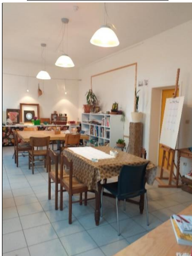
De nieuwe atelierruimte: